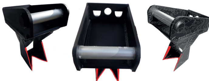
mit Ausführung Lehnhoff original Anschlußrahmen SW 01 / SW 03 / SW 08