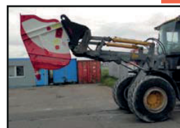
für Radlader / Teleskoplader