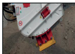
Magnet-Kit + Schalttafel